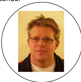
Stefan Schrank Berichte