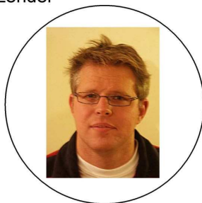
Stefan Schrank Berichte